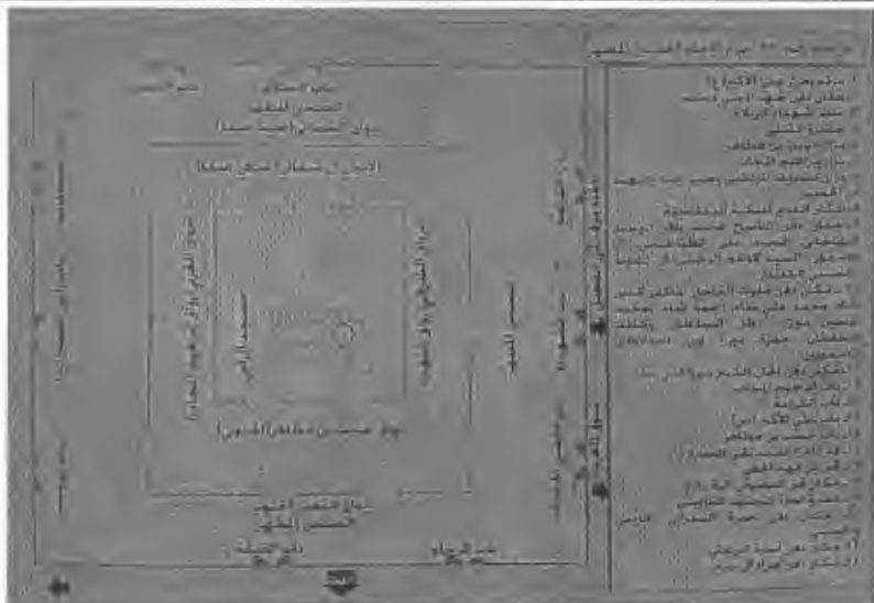
نقشه شماره ۱: پلان مرقد مطهر امام علی (ع) در نجف اشرف، به همراه جایگاه قبور مشاهیر شیعه در بنا