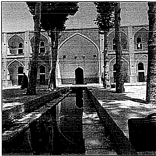
نمایی از مدرسه جدّه بزرگ

به گزارش جناب اصفهانی (همانجا) شمار طلاب ساکن در مدرسه در ۱۳۰۲ ش، ۲۵ تن بوده است. در حال حاضر (۱۳۸۴ ش) سی طلبه از طلاب حوزه علمیه اصفهان در این مدرسه ساکن اند. مدرسه جدّه بزرگ، در مسیر اصلی بازار بزرگ اصفهان، نزدیک به میدان نقش جهان، در ۱۰۵۸ ساخته شد. بنا بر آنچه در وقفنامه مدرسه آمده، دستور بنای آن را جدّه دیگر شاه عباس دوم، حورنیا خانم (یا حورینام خانم / حوریناز خانم) صادر کرده است (چهار وقفنامه، مقدمه احمدی، ص ۹۸، ۱۱۰، ۱۱۳). در نیمه دوم قرن یازدهم / هفدهم، شاردن ۱ ، سیاح فرانسوی، ضمن توصیف بازار اصفهان، از این مدرسه نام برده و دستور بنای آن را، به اشتباه، به یکی از زنان شاه صفی نسبت داده است (ص ۷، ۴۰۷)، حال آنکه حورنیا خانم، که به جدّه کوچک شاه معروف بود، احتمالاً همسر گرجی صفی میرزا و مادر شاه صفی بوده است (ص چهار وقفنامه، همان مقدمه، ص ۹۶-۹۸). مدرسه جدّه بزرگ، همانند مدرسه جدّه کوچک، در دو طبقه بنا شده است. جناب اصفهانی (همانجا) وسعت مدرسه را ۳۲۵۰ مترمربع (۵۰ × ۶۵ مترمربع) و جابری انصاری (ص ۳۰۴) آن را سه جریب شاه، یعنی ۳۱۲۰ مترمربع، ذکر کرده است. در ورودی مدرسه در بازار و در ضلع غربی مدرسه واقع است و کتیبه سردر آن کاشی معرق به خط ثلث محمدرضا امامی، به رنگ سفید بر زمینه لاجوردی، است. حیاط وسیع مرکزی مدرسه بر روی یکی از نهرهای منشعب از زاینده رود به نام «مادی قدین»، معروف به «فدا» یا «فیدن»، بنا شده است (هنرفر، ص ۷۵۸؛ محمودیان، ص ۱۹۲-۱۹۳). این نهر، که از