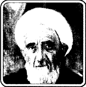
شیخ موسی فروزی (م. ۱۲۸۶ ق)