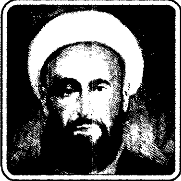
میرزا مهدی اصفهانی (م. ۱۲۵۶ ق)