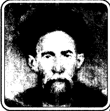
سید موسی زراآبادی (م. ۱۲۵۳ ق)