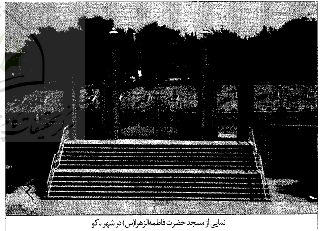
نمایی از مسجد حضرت فاطمه الزهرا (س) در شهر باکو

اگر بخواهیم تاریخ احیای دینی را در این کشور در دهه‌های اخیر جستجو نماییم، باید حداقل تاریخ سه دهه پیش مردم این منطقه را مرور نماییم که با وقوع انقلاب اسلامی ایران احیا شده است. موضوعی که در بیشتر جنبش‌ها و نهضت‌های اسلامی، شیعی و آزادی‌خواه جهان حاضر نیز مصداق پیدا می‌کند. پیروزی انقلاب اسلامی ایران سبب خیزش و خودآگاهی ملل مسلمان شد و در این مسیر سرزمین جمهوری آذربایجان با سابقه وابستگی ارضی و مشترکات فرهنگی - دینی با ایران، تأثیرات زیادی را پذیرفت،