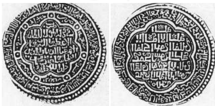
روی و پشت سکه اولجایتو

همچنین سکه‌ای پنج درهمی در آمل ضرب شده که آیه «مُحَمَّدٌ رَسُولُ اللَّهِ وَالَّذِينَ مَعَهُ أَشِدَّاءُ عَلَى الْكُفَّارِ رُحَمَاءُ بَيْنَهُمْ تَرَاهُمْ رُكْعًا سُجَّدًا يَبْتَغُونَ فَضْلًا مِنَ اللَّهِ وَرِضْوَانًا سِيمَاهُمْ فِي وُجُوهِهِمْ مِنْ أَثَرِ السُّجُودِ ذَلِكَ مَثَلُهُمْ فِي التَّوْرَةِ وَمَثَلُهُمْ فِي الْإِنْجِيلِ» (آیه ۲۹ سوره فتح) در آن نقر شده است. در روی دیگر سکه در متن: «لا اله الا الله الملك الحق المبين» و القاب و کنیه پیامبر ﷺ و امامان، «اللهم صلي على محمد المصطفى و على المرتضى و الحسن الزكي و الحسين ...» درج شده است (سرافراز، ۱۳۸۵، ص ۲۲۰). در این سکه، حضرت علی عليه السلام ، امیرالمؤمنین خوانده شده‌اند که در هیچ سکه‌ای قبل از آن دیده نشده است. هم‌چنین کنیه امامان شیعه ذکر شده است، این سکه پرشعارترین و پرمطلب‌ترین سکه شیعی به شمار می‌آید که تاکنون به دست آمده است.