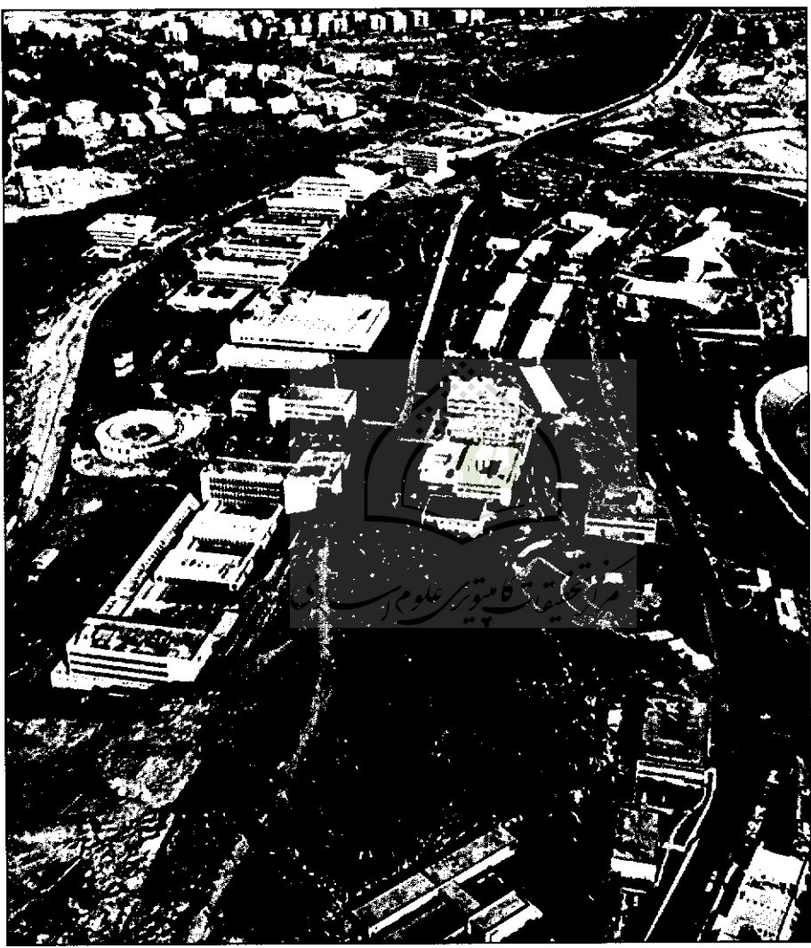
دانشگاه عبری اورشلیم بر فراز کوه اسکوپوس

همان‌گونه که از نام کتاب الاکوار و الادوار النورانیة می‌توان دریافت، تبیین مسأله تناسخ