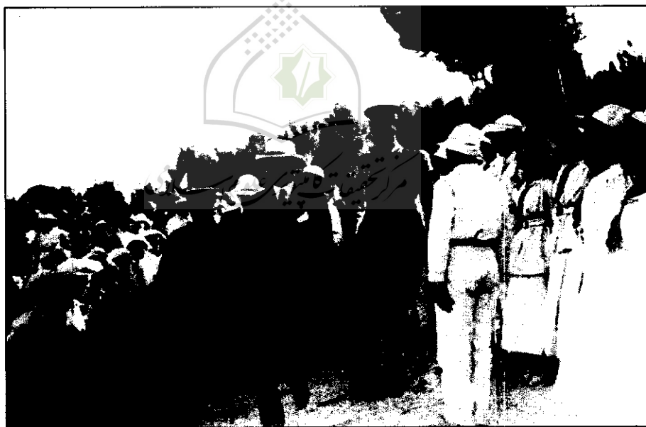
حییم وایزمن و ژنرال آلبی هنگام احداث سنگ بنای دانشگاه عبری اورشلیم در سال ۱۹۱۸

یکی از نکات مورد اهتمام محمد بن نصیر همانند دیگر غلات بوده، امری که به نحو جدی مورد اعتقاد نصیری به قرار گرفته است. درباره تاریخ وفات محمد بن نصیر اختلاف نظر وجود دارد. هاشم عثمان، سال ۲۵۹ / ۸۷۲ را به عنوان سال درگذشت محمد بن نصیر ذکر کرده است. محمد امین غالب طویل که می‌توان او را تاریخ‌نگار رسمی نصیری دانست، گفته است که محمد بن نصیر بعد از وفات امام حسن عسکری علیه السلام (متوفی ۲۶۰ق) در شهر سامرا اقامت داشته و رهبری جامعه نصیری را برعهده داشته که دلیلی برای این گفته در منابع قابل دسترس مشاهده نشد (محمد امین غالب الطویل، تاریخ العلویین، ص ۲۰۲). هر چند گفته وی را می‌توان بازتابی از جایگاه والای محمد بن نصیر در جامعه نصیری دانست.