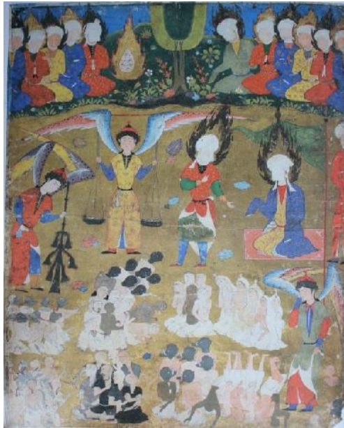
تصویر ۷. روز قیامت، فالنامه، آرتور ساکлер گالری، مأخذ: (Ibid, 190).

در سمت راست نگاره، فرشته‌ای دیگر با لباس‌ها و بال‌های رنگارنگ به مردمی که در روبروی او قرار گرفته‌اند، نگاه می‌کند.