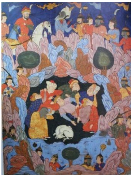
تصویر ۴. اصحاب کهف، فالنامه. مأخذ: (Ibid, 161).