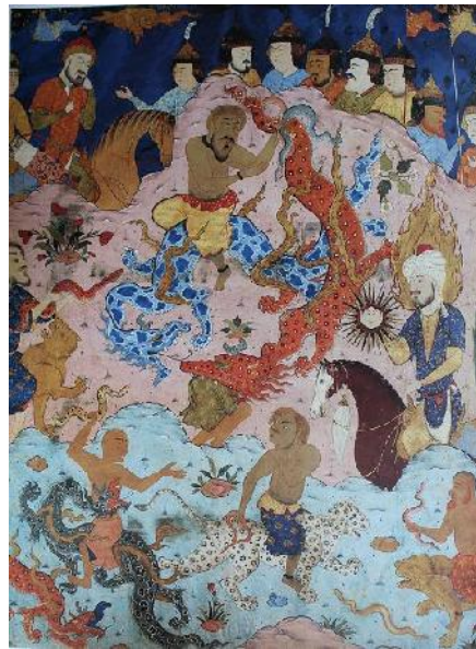
تصویر ۳. معجزه حضرت موسی، فالنامه.

در آورده است. (تصویر ۳). حضرت موسی (ع) در سمت راست تصویر، سوار بر اسبی خوش‌رنگ و زیبا قرار گرفته و نگارگر به سادگی هر چه تمام، نقش خورشید را در کف دستان حضرت موسی (ع) قرار داده و معجزه ید بیضاء ایشان را به تصویر کشیده است. در مرکز نگاره نیز ساحران در حال جادوگری دیده می‌شوند و عصای موسی (ع) به اژدهای نارنجی‌رنگی تبدیل شده و در حال بلعیدن یکی از ساحران است.