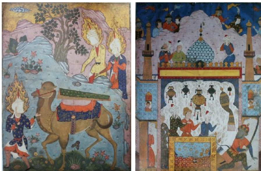
تصویر ۸. معجزه دو انگشت علی (ع)، فالنامه، مأخذ: (Ibid, 128) تصویر ۹. تابوت حضرت علی (ع)، فالنامه، موزه متروپولیتن، مأخذ: (Ibid, 121).

در این نگاره، یکی از مهم‌ترین مکان‌های مقدس و مورد توجه شیعیان یعنی آرامگاه حضرت علی (ع)، مصور شده و نگاره، بیانگر این باور اصیل شیعیان است: باور به کرامات و معجزات ائمه (ع) در زمان حیات و حتی پس از آن. همچنین، نگاره به موضوع زیارت قبور مقدسین شیعه اشاره دارد که بنا به گفتمان تشیع و اعتقاد شیعیان، واسطه میان فیض خداوندی و شیعیان‌اند.