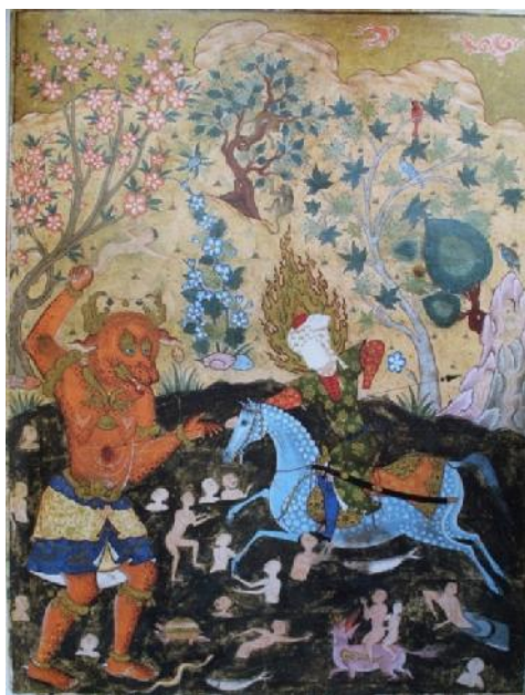
تصویر ۱۰. نجات مردم از دست دیو توسط امام رضا (ع)، فالنامه، موزه لوور، مأخذ: (Ibid, 133).

بی‌ریای عوام نسبت به بزرگان شیعه، ساخته شده‌اند. موجودات دیوسان در تخیل مردم ایران به منزله دشمن قهرمانان نیک شناخته می‌شوند و نبرد با دیوها یکی از ویژگی‌های قهرمانان قصه‌های عامیانه ایرانی است. از این رو، مردم برای بالا بردن مقام شخصیت‌های مذهبی، قصه‌هایی درباره نبرد این شخصیت‌ها با موجودات شر ساخته‌اند که در این نگاره، یکی از همین قصه‌ها به تصویر درآمده است. در این نگاره، امام رضا (ع) با روپند چهره، شعله‌های نورانی دور سر و لباسی فاخر، بر اسبی آبی‌رنگ دیده می‌شود که نیزه‌ای به شکم دیوی بزرگ و خشن وارد کرده است. لباس حضرت امام رضا (ع) با توجه به ایمان و اعتقاد ذاتی اش به رنگ روحانی سبز است؛ قرآن کریم این رنگ را رنگی بهشتی می‌داند و در اینجا نماد دسترسی به قرب الهی الله است (علی پور، ۹۸). رنگ سبز رنگ اسلام، ولایت و طهارت است. رنگ آبی استفاده شده برای اسب، نشان معصومیت صاحب آن است. رنگ آبی، رنگی آرام و الهی و آسمانی است و به معنای رحمت الهی نیز بیان شده است (آیت‌اللهی، ۱۶۴). برخلاف تصویر دیو که مضطرب و سرکش به نظر می‌رسد، امام مظهر آرامش است. همچنین، هنرمند، اندازه دیو را بسیار بزرگ‌تر از امام نشان داده تا بر اهمیت کار امام یعنی مبارزه با پلیدی بیفزاید. رنگ نارنجی متمایل به قرمز دیو رامی‌توان نماد تمایل‌های دنیوی، تهاجم، خسونت و وسوسه‌های شیطانی دانست که مردم را به ضلالت می‌کشاند.